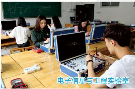
电子信息与工程实验室