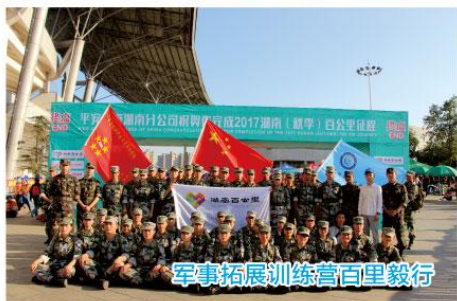
军事拓展训练营百公里毅行