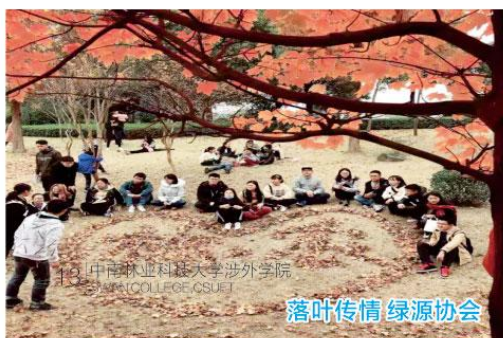
落叶传情 绿源协会