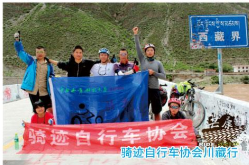
骑迹自行车协会川藏行