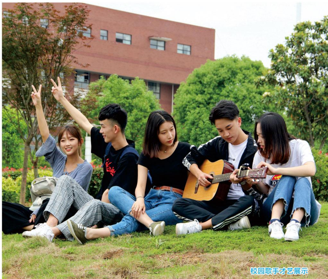
校园歌手才艺展示