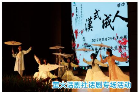
萤火话剧社话剧专场活动