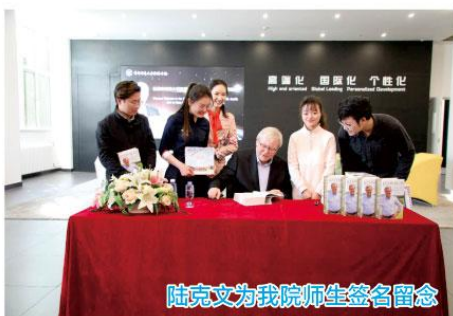
陆克文为我院师生签名留念