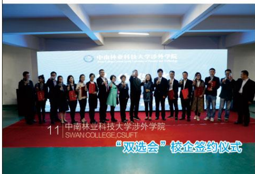
“双选会”校企签约仪式