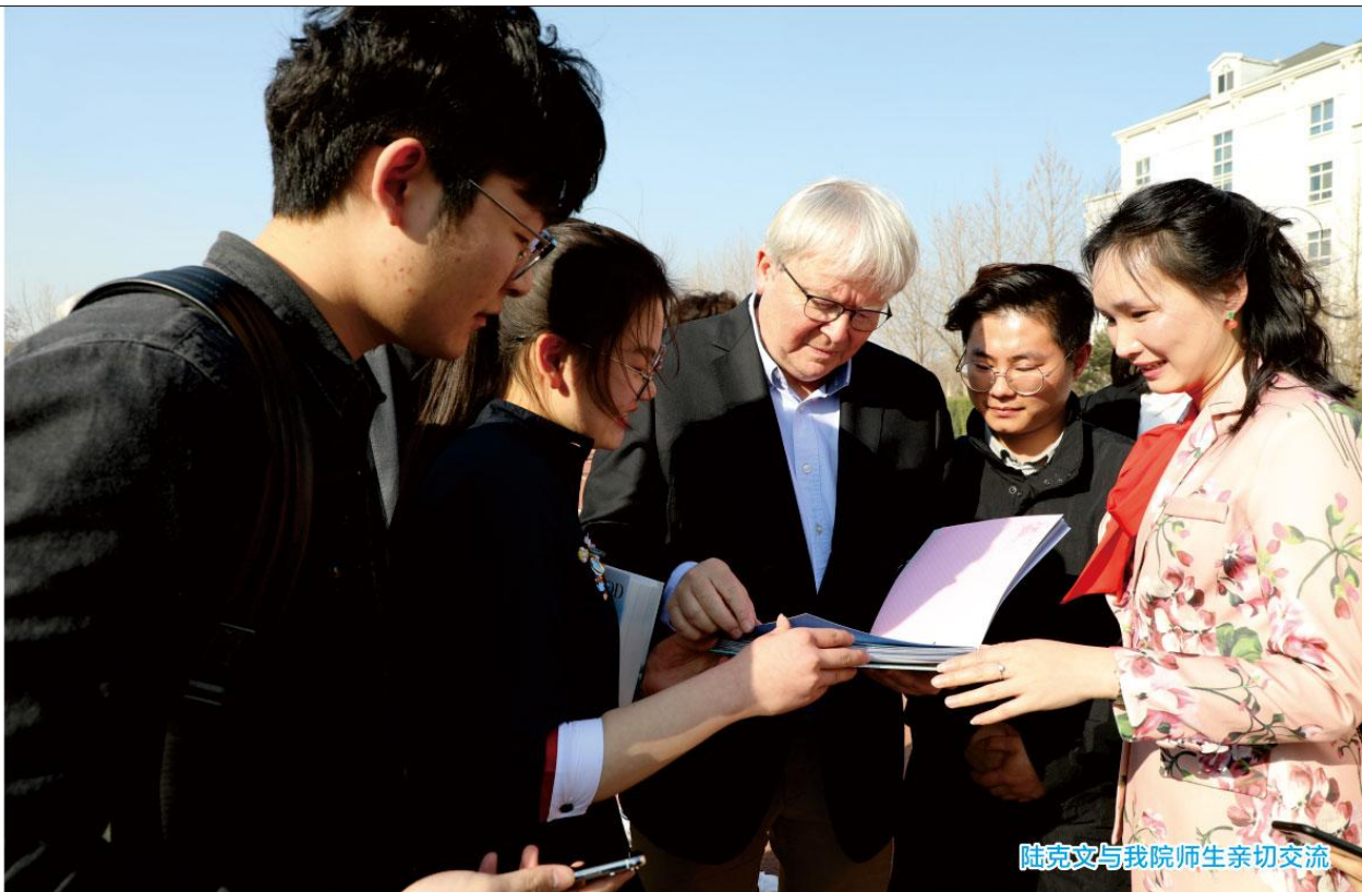
陆克文与我院师生亲切交流