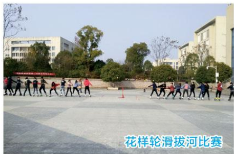
花样轮滑拔河比赛