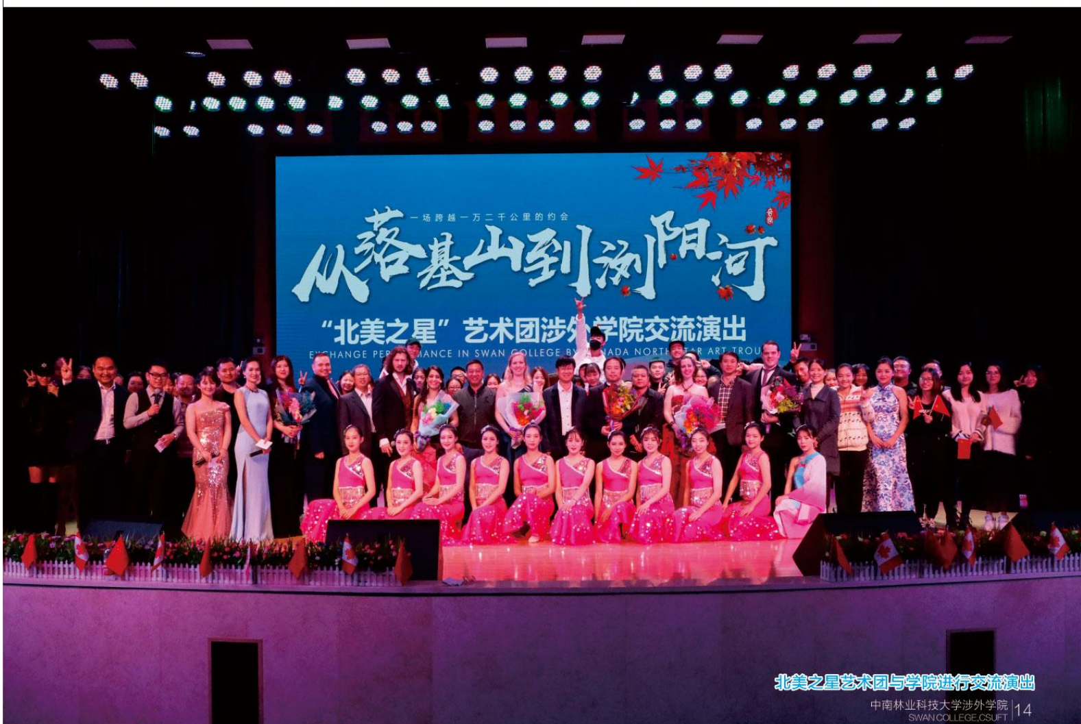
北美之星艺术团与学院进行交流演出