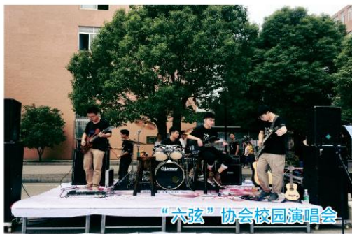
“六弦”协会校园演唱会