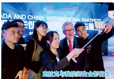
克拉克与我院师生合影留念