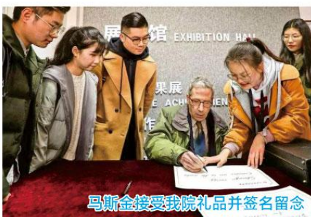
马斯金接受我院礼品并签名留念