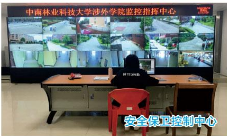
中南林业科技大学涉外学院监控指挥中心 安全保卫控制中心