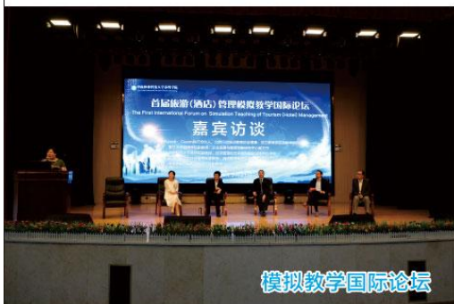
模拟教学国际论坛