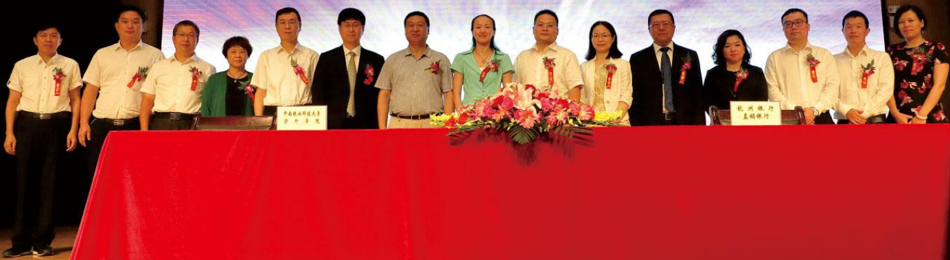
战略合作签约仪式